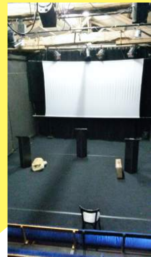
La salle de spectacle