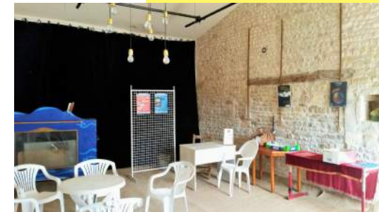
La salle du Foyer